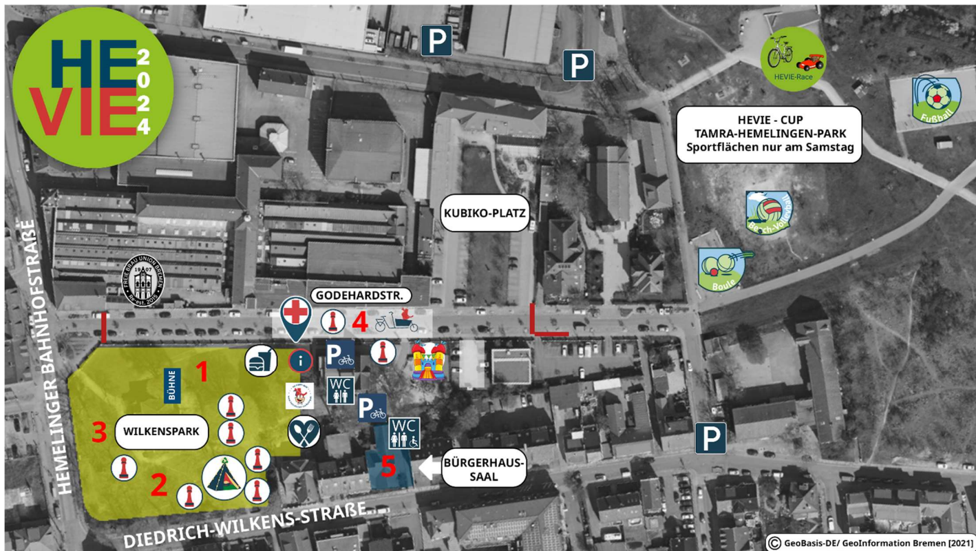
Abb. 1 Gesamtansicht VA Flächen HEVIE 2024

Am zweiten Tag, Sonntag, 01.09.2024 planen wir die Freizeit- und Gewerbemesse mit Bühnenprogramm von 11 bis 17 Uhr auf den eingezeichneten Flächen Abb. 2 im Wilkens-Park, einen kleinen Teil der Godehardstr. (Abb. 1 Gesamtübersicht VA Flächen)