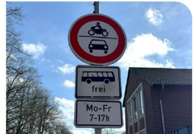
VZ 260, hier beispielhaft mit Zusatzzeichen 1024-14 und 1042-33

... kann einen wichtigen Beitrag zur Verkehrssicherheit vor der Schule leisten, sofern auch das Geh- und Radwegenetz der Kommune für Kinder sicher ist.