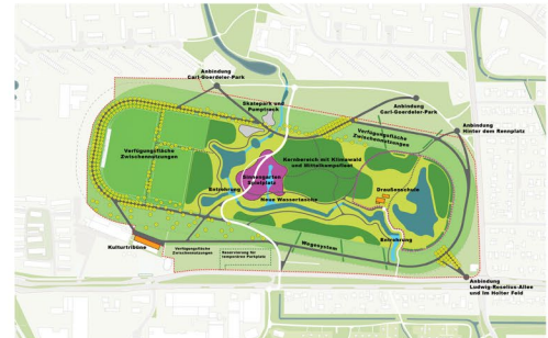
Basispark für Alle