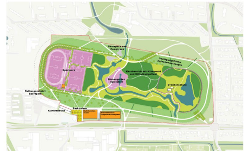
Endausbau mit allen Bausteinen